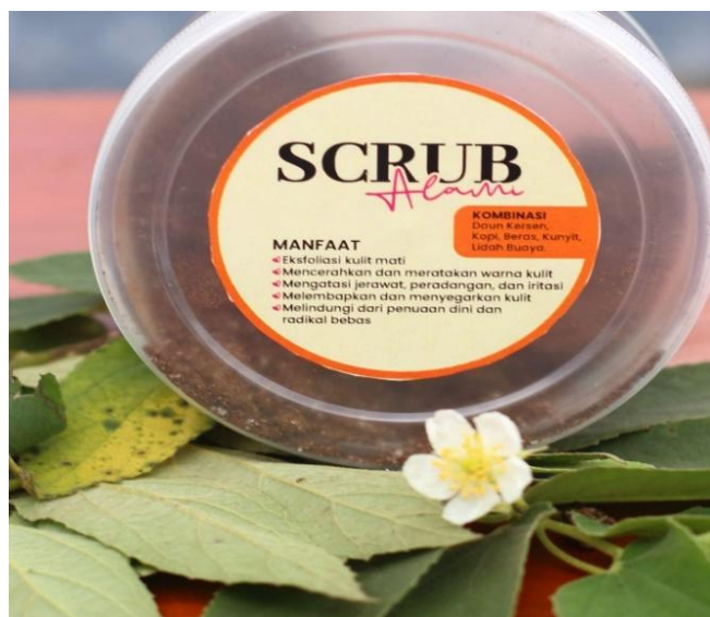
Gambar 1. Produk desain scrub bubuk alami

Selain itu, menggunakan bahan alami seperti daun kersen, kopi, beras, kunyit, dan lidah buaya meningkatkan manfaat eksfoliasi dan antioksidan produk, serta membuatnya mudah terurai secara hayati (biodegradable), sehingga bilasan tidak mencemari lingkungan. Scrub ini tidak mengandung bahan kimia berbahaya, jadi aman untuk digunakan dalam jangka panjang bahkan pada kulit yang rentan terhadap alergi atau peradangan. Oleh karena itu, produk ini tidak hanya membantu perawatan kulit dengan baik, tetapi juga mendorong gaya hidup yang lebih ramah lingkungan dan keberlanjutan industri kosmetik herbal di masa depan.